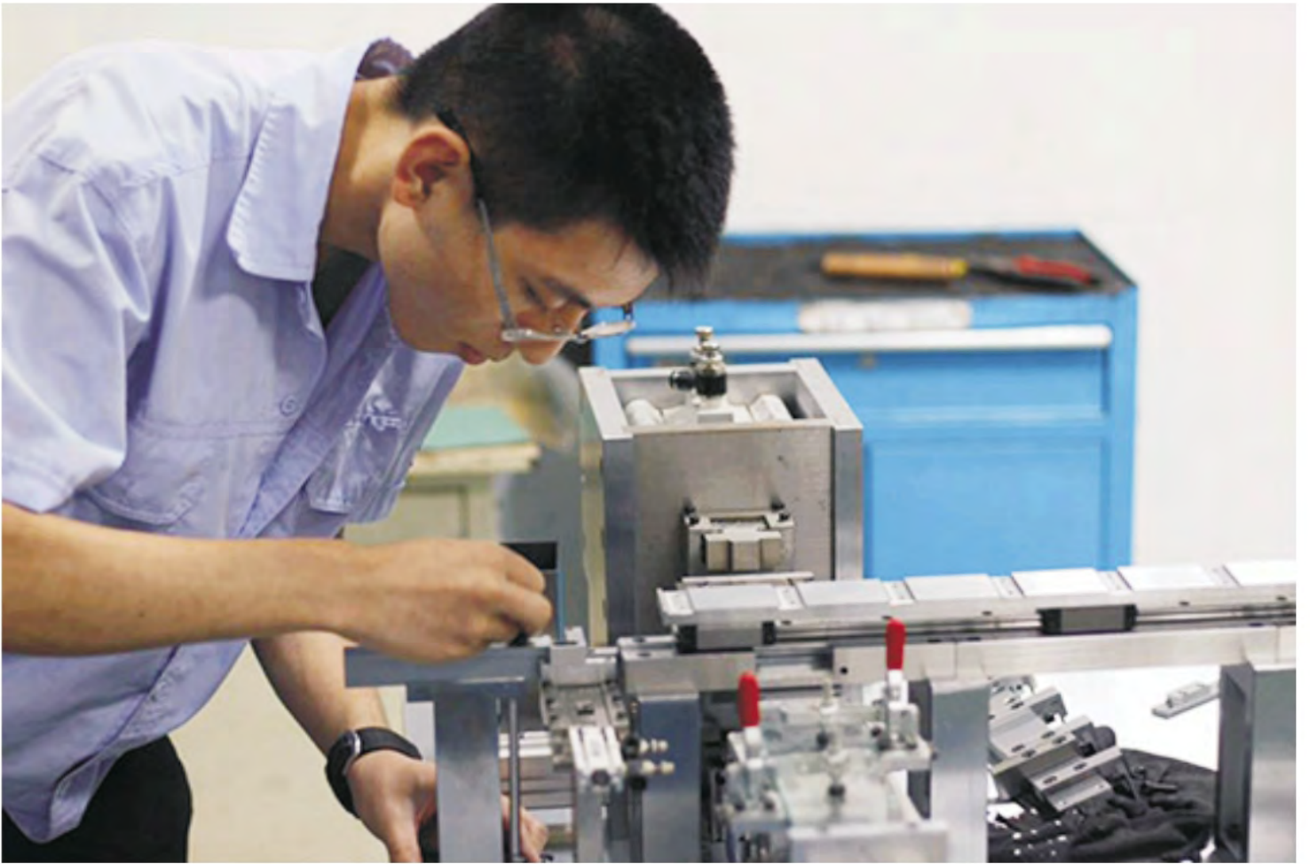
《工匠精神》